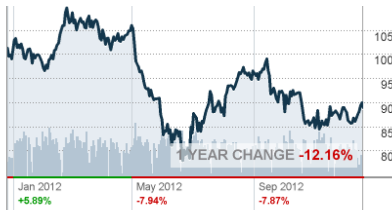
Հում նավթի հաշխարհային գներ (տարեկան տատանումներ)

Մեկ տարվա կտրվածքով, նավթային գների երկարաժամկետ միտումը նվազող էր: Անցած շաբաթ անկումը կազմեց 12,16 տոկոս տարեկան կտրվածքով, մասնավորապես Չինաստանի պահանջարկի թեթևացման և նավթային արտադրության ավելացման ու մատակարարման նկատառումների պատճառով (տե՛ս ստորին գրաֆիկը):