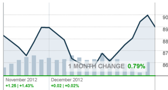
Հում նավթի հաշխարհային գներ (ամսական տատանումներ)

Մեկ տարվա կտրվածքով, նավթային գների երկարաժամկետ միտումը նվազող էր: Անցած շաբաթ անկումը կազմեց 12,16 տոկոս տարեկան կտրվածքով, մասնավորապես Չինաստանի պահանջարկի թեթևացման և նավթային արտադրության ավելացման ու մատակարարման նկատառումների պատճառով (տե՛ս ստորին գրաֆիկը):